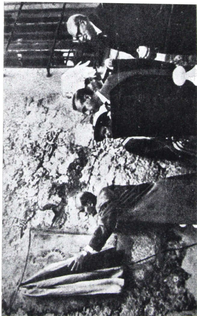
El embajador argentino descubre la lápida en el Torreón de los Guzmanes